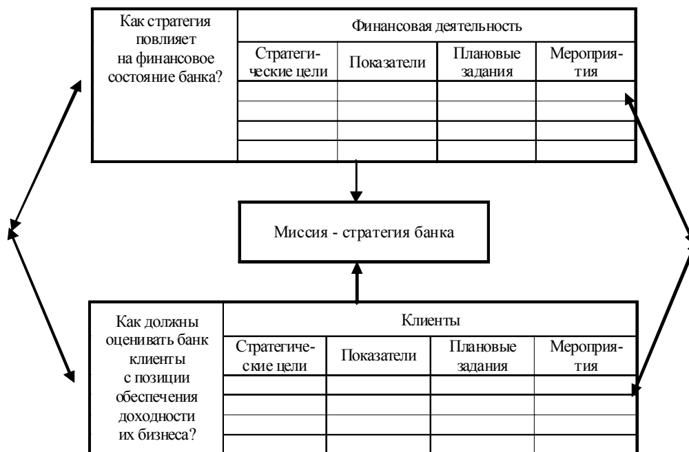
Рис. 2. Примерная схема стратегической карты во взаимосвязи с направлениями банка

3-й этап. Определение ключевых показателей эффективности (КПЭ), связанных со стратегическими целями, которые предусматривают такие атрибуты, как единица измерения, значе-