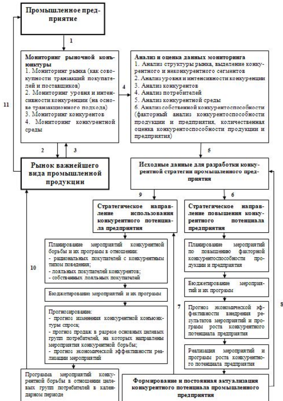
Рис. 2. Авторское видение процесса разработки и реализации конкурентной стратегии промышленного предприятия

планировании мероприятий непосредственно конкурентной борьбы;