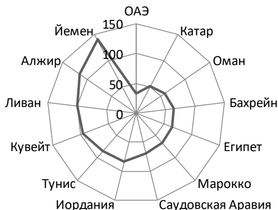
Рис. 1. Места стран БВСА в рейтинге ТТСИ 2019 года

в качестве индикатора устойчивости при оценке конкурентоспособности в области путешествий и туризма [10]. В целом регион БВСА значительно повысил свою конкурентоспособность в области туризма, что отражает изменение положения субрегионов и отдельных стран в ТТСИ. В 2018 году 12 из 15 стран БВСА, охваченных индексом, улучшили показатели по сравнению с предыдущим годом, благодаря чему регион опередил средние мировые показатели роста конкурентоспособности. Это тем более важно, так как совокупная доля туризма в региональном ВВП была выше, чем в других регионах мира. Регион БВСА